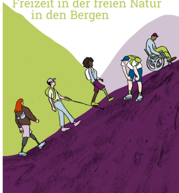
Booklet: Die Bergwelt für alle.