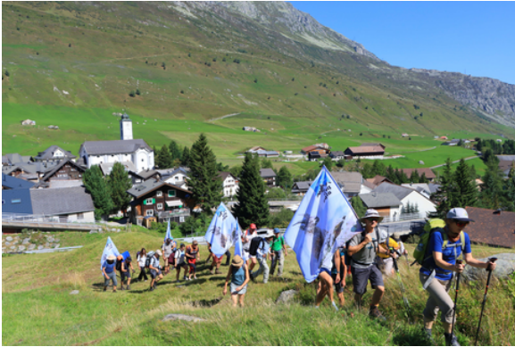
Wandern für den Alpenschutz.

Die traditionellen «Feuer in den Alpen» machen auf den Schutz des Alpenraums aufmerksam. Über Jahre hinweg stand das Alpenfeuer für grenzüberschreitendes Engagement. In jüngerer Zeit verlor das Format jedoch an Resonanz.