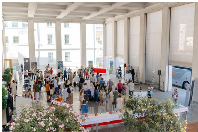
Zweites Liechtensteiner ZukunftsForum Alpen Ende Juni 2025 in Schaan

Im Vorfeld der Tagung fand die jährliche Delegiertenversammlung von CIPRA International statt.