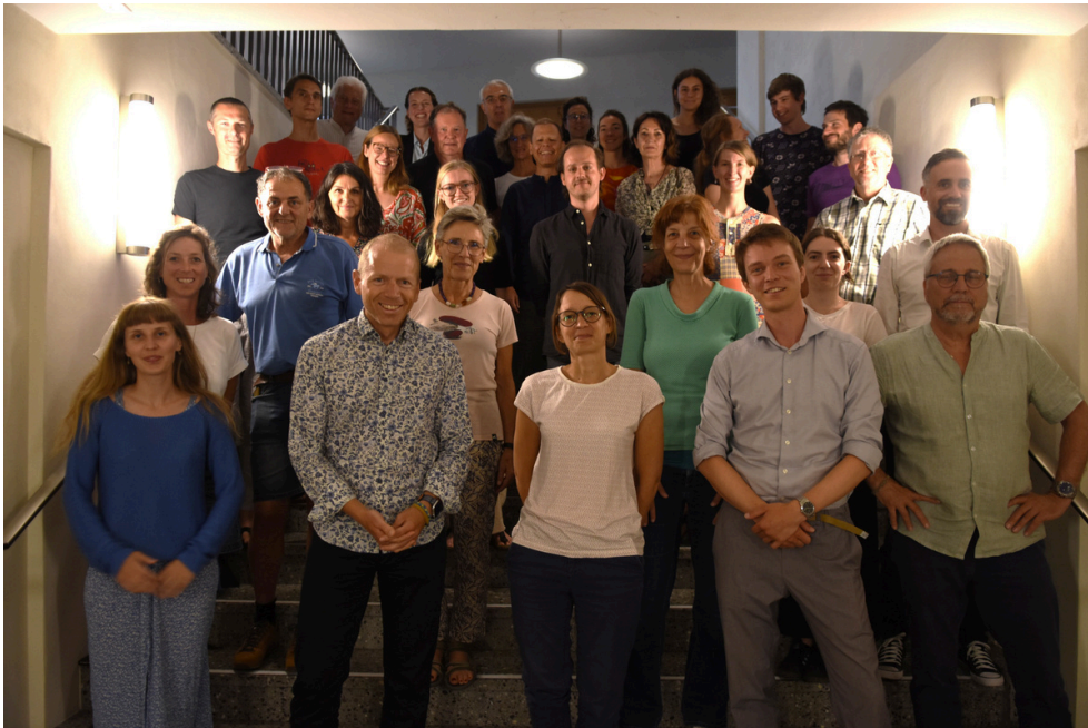
Delegierte der CIPRA an der Delegiertenversammlung 2025 in Schaan, Liechtenstein