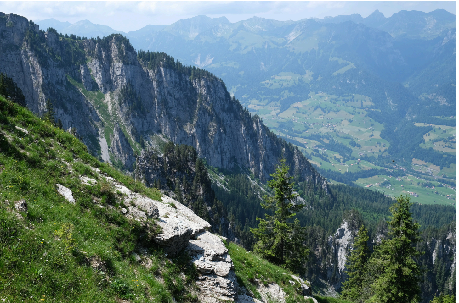
Blick von oben ins Simmental.

Wir danken allen Mitgliedsorganisationen, Unterstützerinnen, Unterstützern, Partnerinnen und Partnern für die erfolgreiche Zusammenarbeit im Jahr 2025!