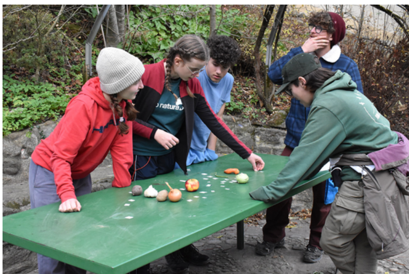
Visit Utopia organisiert am 15. und 16. November durch Pro Natura Neuchâtel auf der "Hofgemeinschaft Ratzenbergli" in Niedermühlern, Bern.

Das Projekt wird durch das Programm Erasmus+ der Europäischen Union sowie durch Movetia finanziell unterstützt. Movetia fördert Austausch, Mobilität und Kooperation in der Aus- und Weiterbildung sowie in der Jugendarbeit in der Schweiz, in Europa und weltweit.